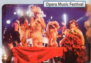
Opera Music Festival